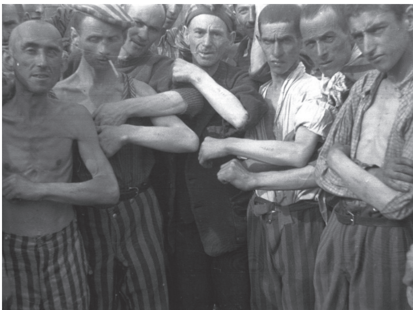
Weinig gedeporteerden overleven de concentratie- en vernietigingskampen van het nazi-regime. Hier poseren enkele uitgemergelde gevangenen van Buchenwald na hun bevrijding in april 1945.