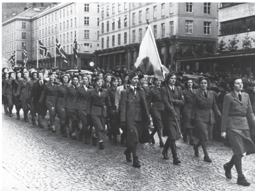
De Noorse Nasjonal Samling is een van de vele antidemocratische partijen die in de jaren dertig in Europa het levenslicht zien. Deze gelijkgezinde politieke organisaties zijn voor nazi-Duitsland geschikte kandidaten voor collaboratie.

Om de bezetting in goede banen te leiden zoekt nazi-Duitsland samenwerking met burgers die hun gunstig gezind zijn. Het doel is om de veroverde gebieden diepgaand en blijvend te herschikken naar het nationaal-