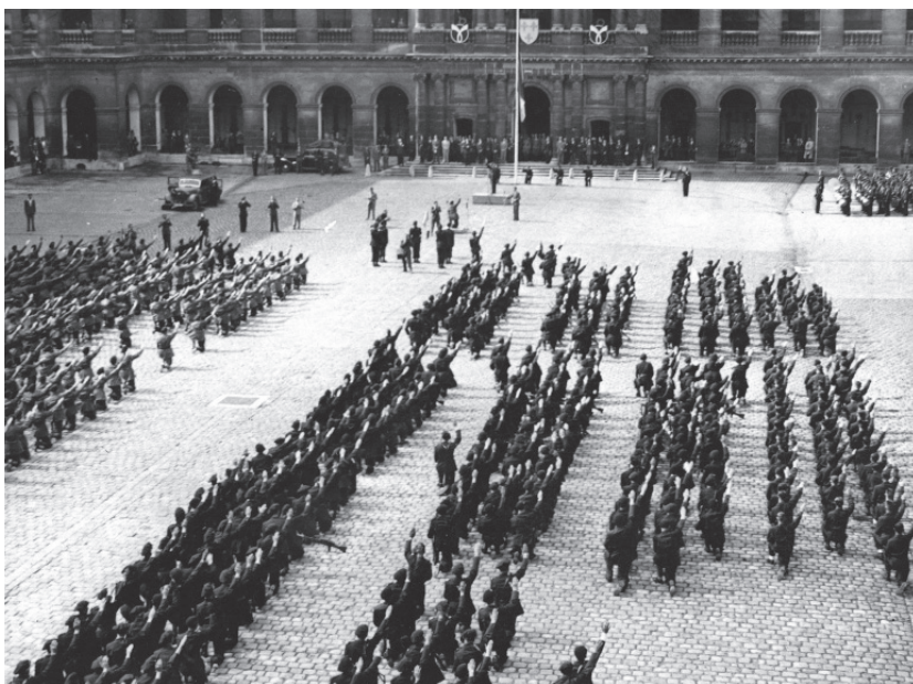
De Milice française is als paramilitaire formatie van het Vichy-regime in Frankrijk symbool van de radicale collaboratie. De leden, met een kenmerkende baret, helpen de Duitse politionele diensten in de gewelddadige strijd tegen het verzet, het opsporen van werkweigerars en het oppakken van Joden.

socialistische mens- en wereldbeeld. Dat gebeurt uiteraard het best met betrouwbare krachten die er eenzelfde mening op na houden. Er is geen plaats voor traditionele elites die weigeren mee te werken. Is hun invloed of expertise niet te negeren, dan zoekt de bezetter desnoods een werkbaar evenwicht, zij het altijd volgens zelfbepaalde spelregels en beleidsprioriteiten. Partijen met hetzelfde gedachtegoed vragen en krijgen vaak het vertrouwen om op te treden als hofleveranciers van vacant verklaarde functies en diensten. Met uitsluiting van de andere partijen krijgen zij het politieke monopolie. In ondergeschikte verenigingen en verwante werkingen onderrichten ze mannen, vrouwen, jongeren en kinderen verder in de autoritaire ideologie en tucht. Ze vormen een dankbare en gedisciplineerde wervingsreserve. De leden laten zich vlot rekruteren om de plaats in te nemen van democratisch verkozen mandatarissen en afgezette of met pensioen gestuurde ambtenaren. Tegelijk kandideren ze voor functies in de vele nieuwe administraties, die – geschoeid op nationaalsocialistische leest – de gewrichten vormen van de dictatoriale staatsordening. Sympathiseren-