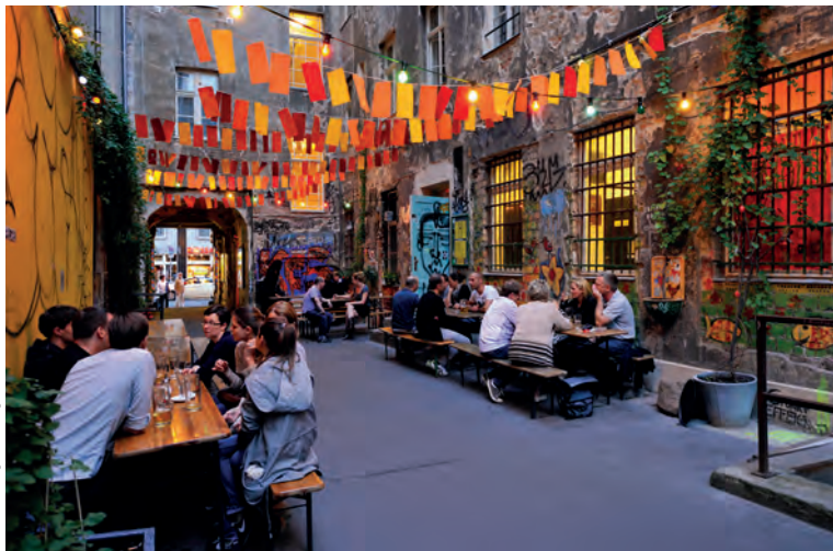
Een binnenplaatsje van de Hackescher Markt