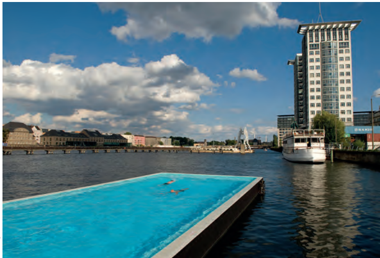
In Kreuzberg drijft het Badeschiff op de Spree.

geen enkel is te vergelijken met het drijvende bad op de Spree, bij de kruising van Kreuzberg, Treptow en Friedrichshain. Voor een zomerse uitstap! 📍 blz. 91.