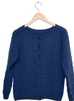
sering, p. 105