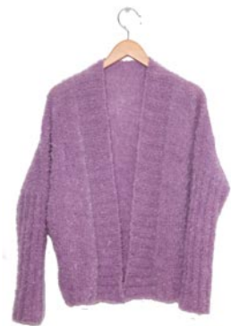
anjer, p. 103