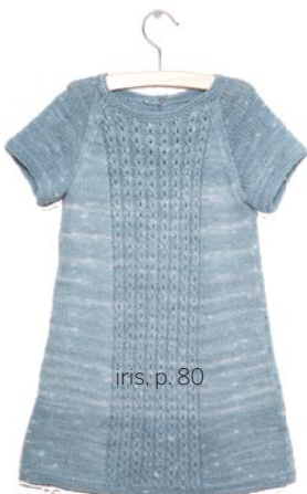
iris, p. 80