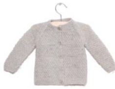
lelietje-van-dalen, p. 88