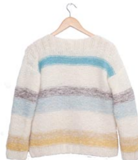
boterbloem, p. 101