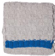
tulp, p. 122