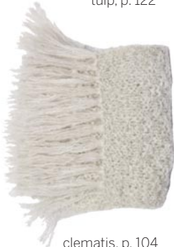
clematis, p. 104