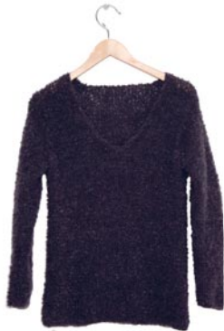
lathyrus, p. 104