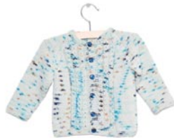
lelie, p. 79