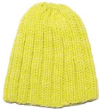
tulp, p. 122