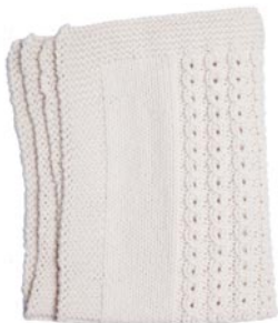
roos 1, p. 82