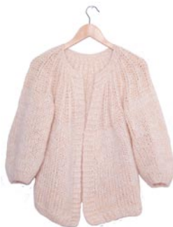
primula, p. 120