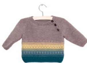
akelei, p. 100