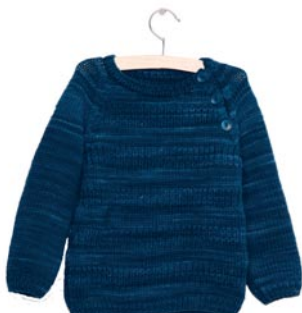
agapanthus, p. 89