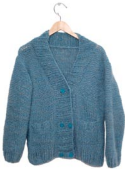
veronica, p. 98