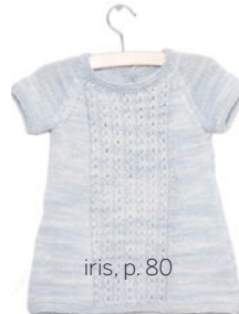
iris, p. 80