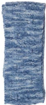
lavendel, p. 107