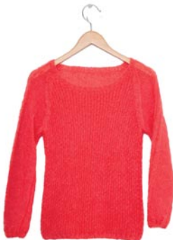
papaver, p. 117