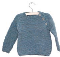
agapanthus, p. 89