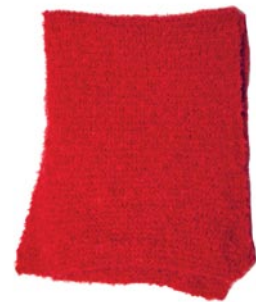
sleutelbloem, p. 123