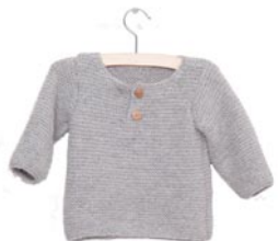
klaver, p. 78