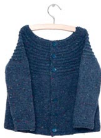
madeliefje, p. 108