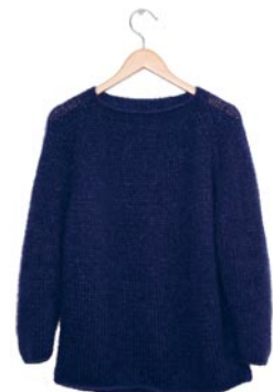
marjolein, p. 112