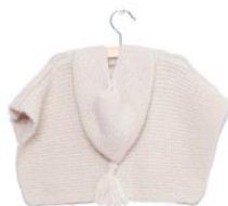
dotterbloem, p. 86