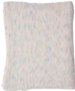
narcis, p. 115