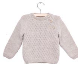
agapanthus, p. 89