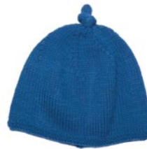
paardenbloem, p. 87