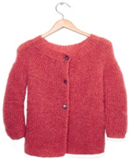
zonneroosje 2, p. 114