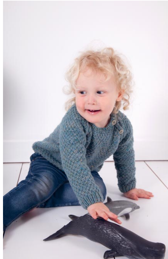
Donkerblauwe kindertui Agapanthus op p. 89 in streepjes boordsteek 1/1, lichtblauwe kindertui Agapanthus op p. 89 in gerstekorrelsteek, kindermuts Geranium op p. 88.