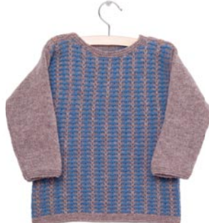
grasklokje, p. 110