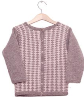
blauwewegen, p. 113