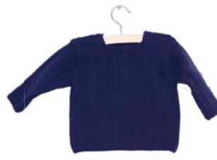
bosanemoon, p. 91