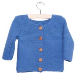
violetje, p. 78