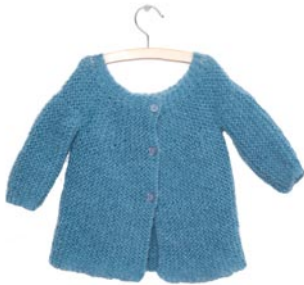
zonneroosje 1, p. 113