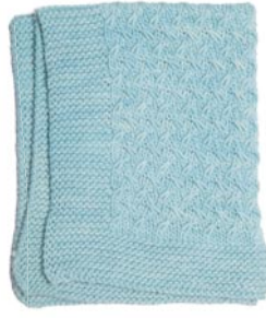
roos 3, p. 82