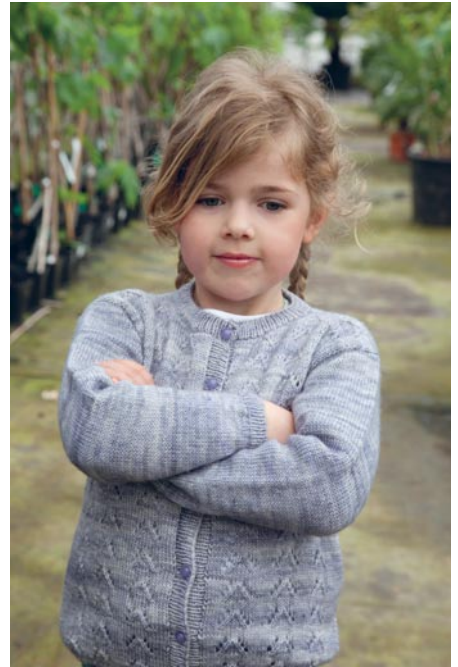
Beige damestrui Korenbloem op p. 96, grijze kindercardigan Anemoon op p. 97.