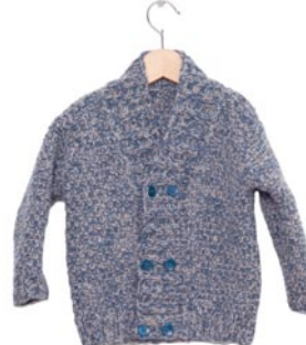
phlox, p. 106