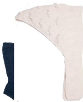
geranium, p. 83