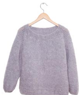
korenbloem, p. 96