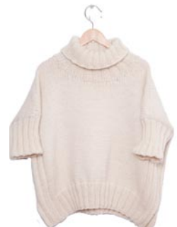
edelweiss, p. 119