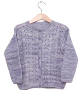
anemoon, p. 97