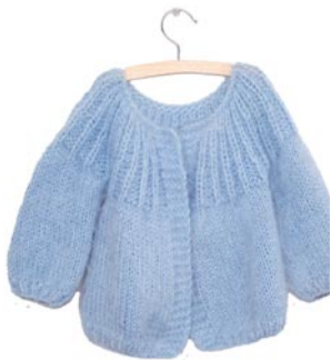
primula, p. 121