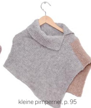
kleine pimpernel, p. 95