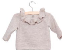
margriet, p. 93