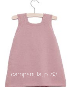
campanula, p. 83