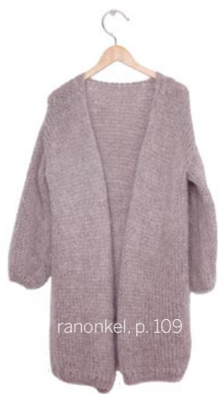
ranonkel, p. 109