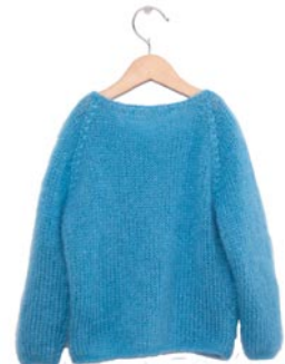
marjolein, p. 111