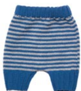
vergeet-me-nietje, p. 111