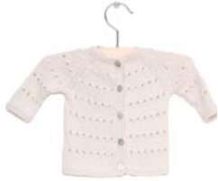
munt, p. 81