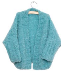
anjer, p. 102