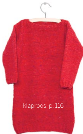
klaproos, p. 116