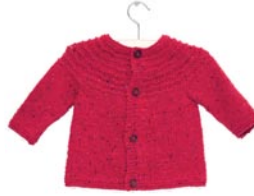
madelief, p. 108