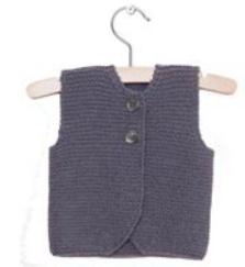
rozemarijn, p. 87