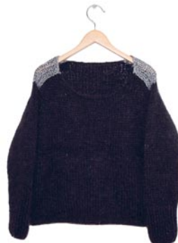
kattestaartje, p. 95