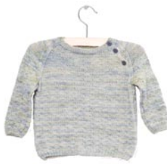
cactus, p. 85