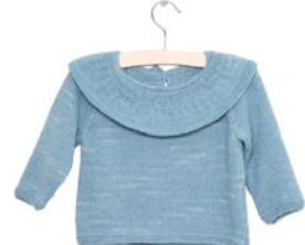
margriet / platte kraag, p. 93