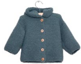
dovenetel, p. 99