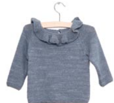
margriet, p. 93