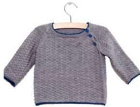
cactus, p. 85