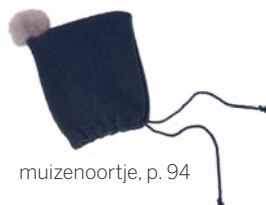
muizenootje, p. 94