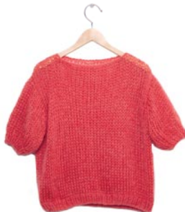
pioen, p. 113