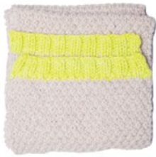
tulp, p. 122