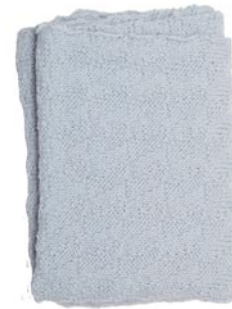
zonnebloem, p. 88