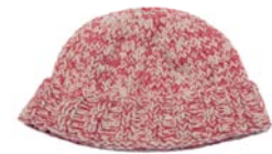
lobelia, p. 106