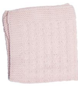
roos 2, p. 82