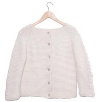
sneeuwkllokje, p. 92