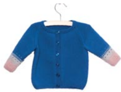
aster, p. 114