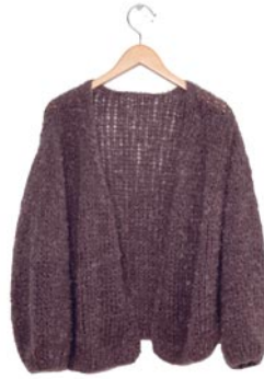
ranonkel, p. 109