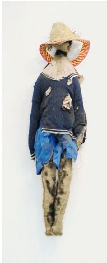
Jos De Gruyter & Harald Thys, Die schmutzigen Puppen von Pommern 011, 024, 025, 036, 2013 en 2014, jute, hooi, stro en textiel. Galerie Micheline Szwajcer en privécollectie.