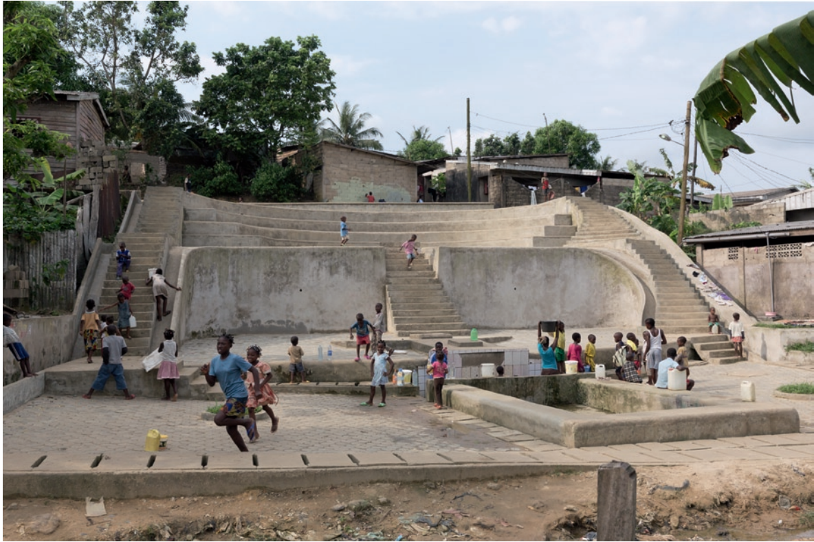
Philip Aguirre y Otegui, Théâtre source, Ndogpassi III, Cameroon, 2013 , foto's. Collectie kunstenaar.