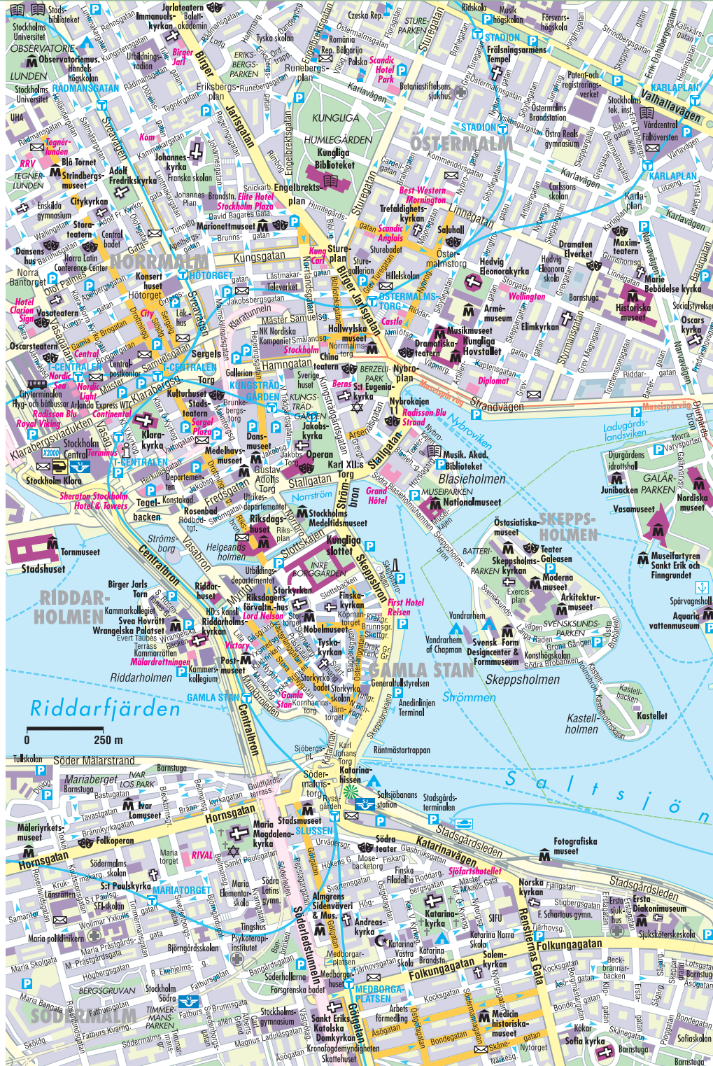
Foto boven: hier woont iedereen op een eiland. Stockholm is doordrenkt van water en wordt ook wel het 'Venetië van het noorden' genoemd.

De Zweedse koning resideert tegenwoordig in het paleis Drottningholm en vertoef hier slechts zelden. Vandaar dat veel vertrekken toegankelijk zijn voor het publiek. Ook de schatkamer en antiecollectie van Gustaaf III zijn te bezichtigen. Een hoogtepunt is de aflossing van de wacht op het paleisplein, dagelijks om 12.00 uur. Niet ver van de koninklijke residentie staan de kathedraal en de 18de-eeuwse beurs waarin nu het Nobelmuseum huist. De boeiende tentoonstelling biedt informatie over Alfred Nobel en beroemde Nobelprijswinnaars. De Tyska Kyrkan (Duitse kerk) in het zuiden van Gamla Stan herbergde oorspronkelijk een ildehuis en werd pas in de 16de eeuw verbouwd tot een kerk. Haar 96 meter hoge toren is de hoogste in de oude stadskern. Ook het tussen 1641 en 1674 geconstrueerde Ridarhuset ten westen van de