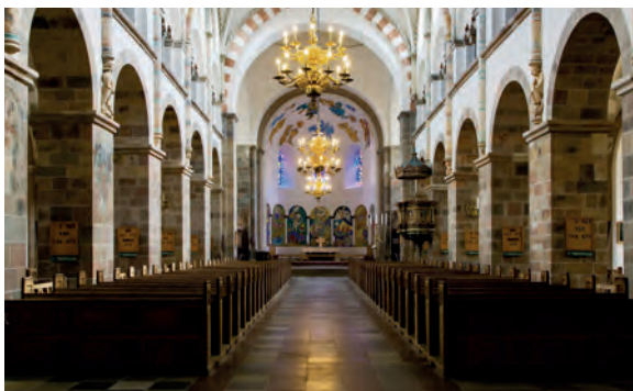
In de 12de eeuw werd de domkerk van Ribe opgetrokken.

plaats vermeld als bisschopszetel, in de 12de eeuw richtten de Deense heersers uit de Waldemarperiode er koninklijke residenties op. Hans Tausen, de leerling van Luther die in Denemarken voor een doorbraak van de reformatie zorgde, woonde halverwege de 16de eeuw vele jaren in de kathedraalstad. De hele middeleeuwen lang was Ribe een bloeiende handelsstad