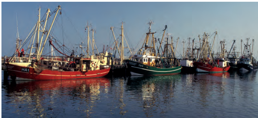
In de haven van Rømø liggen veel visserboten, maar ook particuliere plezierboten voor anker.

***Rømø Het zuidelijkste van de Deense Waddeneilanden is vanaf het vasteland met de auto te bereiken over een bijna tien kilometer lange dam. Hoewel het eiland amper 130 km 2 groot is, is de natuur er ontzettend gevarieerd. Het bij eb droogvallende wad in het oosten vormt een scherp contrast met de naar de open zee gerichte westkust. In het binnenland gaat het drasland over in heide en dennenbossen. Vooral dankzij het duizend meter brede zandstrand dat zich aan de hele westkust uitstrekt, heeft Rømø zich ontwikkeld tot een van de populairste vakantiebestemmingen in Denemarken. Het eiland telt jaarlijks meer dan een miljoen overnachtingen. De talloze comfortabele vakantiewoningen en goede toeristische infrastructuur zijn vooral heel aantrekkelijk voor gezinnen met kinderen. Het zuidelijke deel van het strand is bereikbaar met de auto en zowel voor zonzonbidders als adepten van hippe strandporten