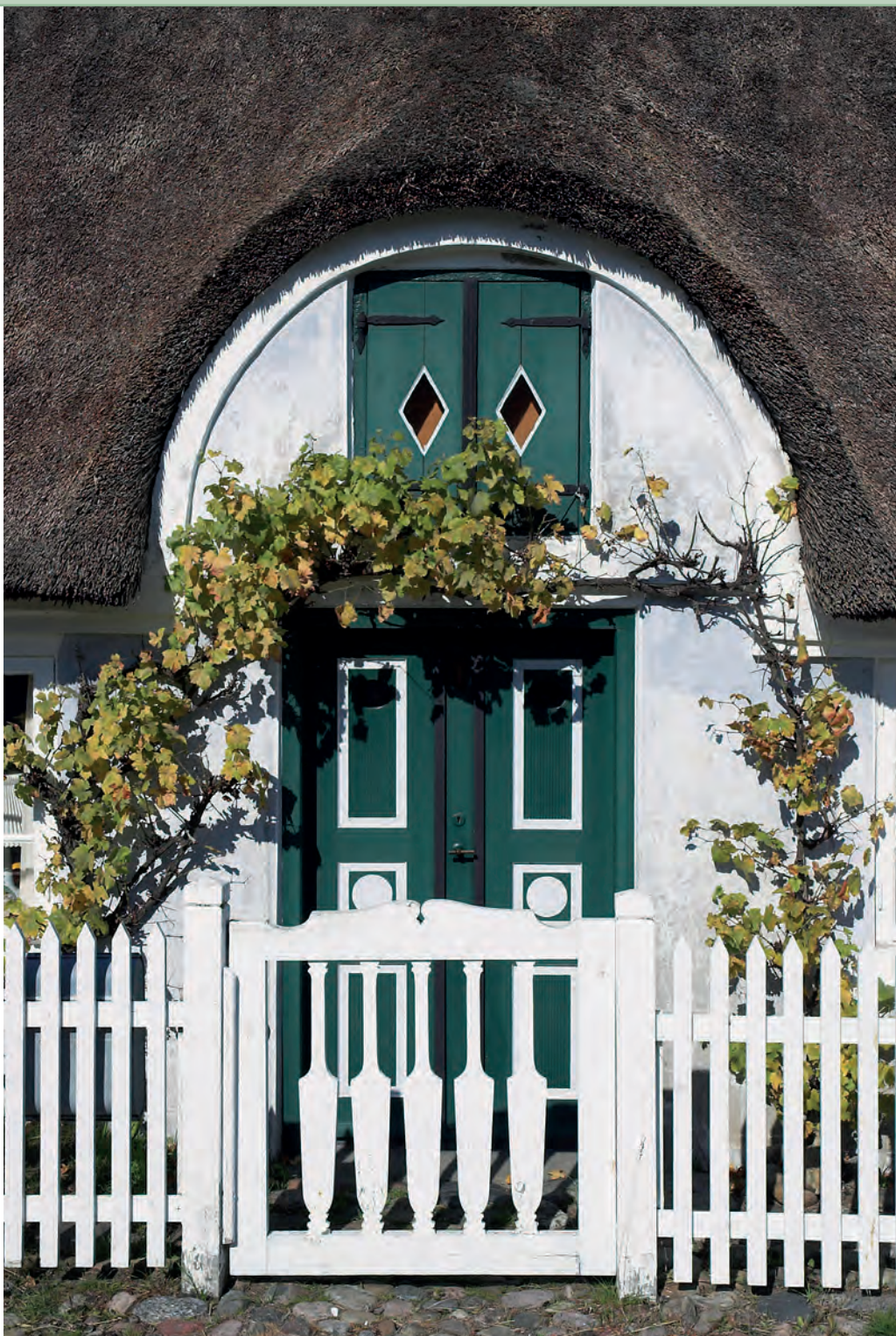
Foto rechts: de bekoorlijke ingang van een typisch oud huis in Sonderhø, een pareltje op het Deense eiland Fanø

met rieten dak uit de vroege 18de eeuw verleent het Fanø Museum inzicht in het dagelijkse leven van de voorbije eeuwen. Sonderhø in het zuidoosten is de tweede grootste plaats van het eiland en een schilderachtig dorp. De met riet bedekte langhuizen in de historische dorpskern stammen uit de 18de en 19de eeuw, toen Sonderhø het economische hart van het eiland en centrum van de Deense scheepsbouw was. Toen Nordby die koppositie in de tweede helft van de 19de eeuw van Sonderhø afsnoepte, droogde de geldstroom op en bleven modernisering uit. Zo komt het dat de oorspronkelijke inrichting van de huizen behouden bleef en ze nu op de monumentenlijst staan. Met stip genoteerde bezienswaardigheden in Sonderhø zijn de Sonderhø Mølle met het molenmuseum, de kerk van Sonderhø en het Kroman, een voormalige winkel met fabriek waar nu het kunstmuseum van Fanø werken van Deense schilders uit de 19de en 20ste eeuw exposeert. In het driehonderd jaar oude Hannes Hus woonde anno 1900 de weduwe van een kapitein die zoals zo veel andere Sonderhøingers bij een schipbreuk om het leven kwam. De permanente tentoonstelling herinnert aan haar lot en dat van andere zee-mansweduwen. In de van 1722 daterende herberg Sonderhø Kro worden streekgerechten zoals gerookte vis of lam geserveerd.