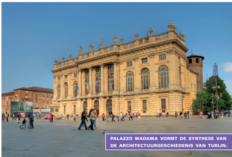
PALAZZO MADAMA VORMT DE SYNTHESE VAN DE ARCHITECTUURGESCHIEDENIS VAN TURIJN.

Palazzo Madama (detailkaart C2): piazza Castello C 011 443 35 01 W palazzomadamatorino.it . Geopend di.-za. 10.00-18.00 u, zo. 10.00-19.00 u. Toegangspreis: € 12; kortingen mogelijk. Dit hybride en ongewone gebouw is de hoofdkantoor van het museo municipale d'Arte Antica en vormt op zich een synthese van de architectuurgeschiedenis van Turijn. Als de muren konden spreken zou je de geschiedenis van Turijn van de Romeinse tijd tot de 19de eeuw te horen krijgen. De Porta Decumana uit de Romeinse tijd, die de toegang tot de stad markeerde, werd in de middeleeuwen een burcht en daarna, in de 15de eeuw, een vierkant kasteel. Het palazzo krijgt zijn huidige naam pas in de 18de eeuw dankzij Christina van Frankrijk, 'Madama Reale', die er ooit woonde. Restauratiewerkzaamheden