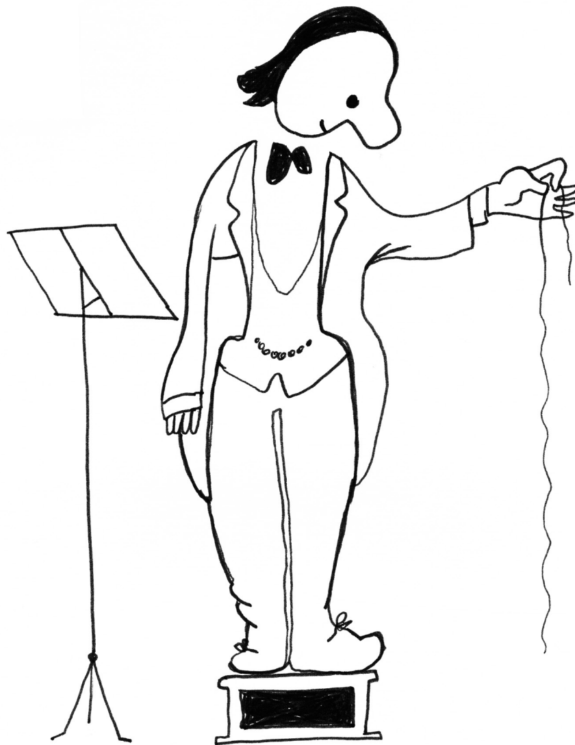
Dirigent met Koordje