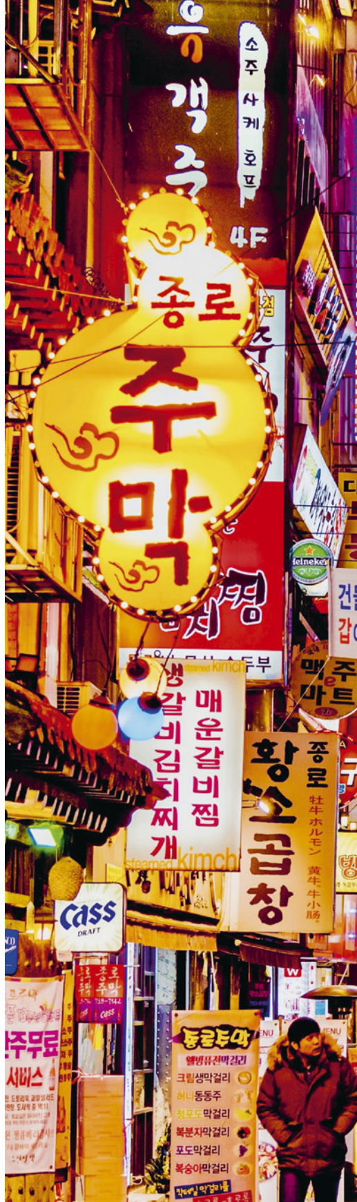
RECHTS: verlichte gebouwen in nachtelijk Seoel.

Om echt te snappen hoe mensen denken, zich gedragen en zich voelen, en waarom dat zo is, is het belangrijk om inzicht te krijgen in hun herkomst en om