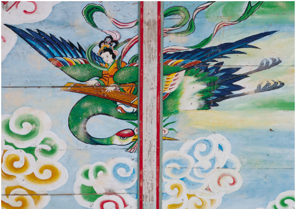
BOVEN: een kleurige schildering in de boeddhistische Pohyonsa-tempel op de berg Myohyang in Noord-Korea.

De invloed van het boeddhisme hield aan – meerdere koningen, andere leden van het koningshuis en edelen waren boeddhisten en werden monniken. Het boeddhisme was nog altijd de staatsgodsdienst, maar de principes van het confucianisme begonnen de overheidsstructuur vorm te geven. In de tweede helft van Koryŏ-dynastie nam de invloed van het boeddhisme af en ontstond het neoconfucianisme – een filosofische school die de mystieke elementen van het boeddhisme verwierp en de voorkeur gaf aan een rationelere ethische filosofie.