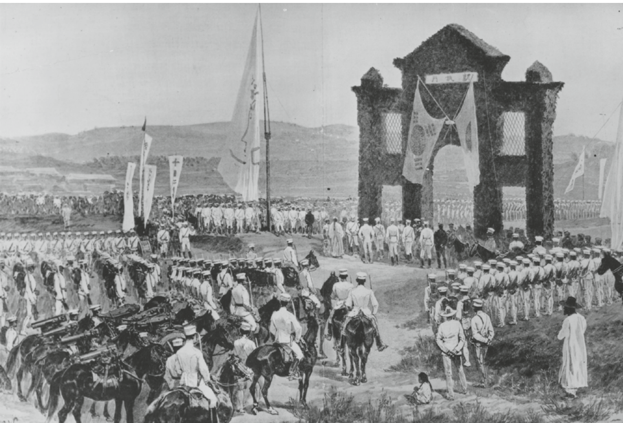
BOVEN: het Japanse leger in Seoel in november 1894, na de overwinning in de Chinees-Japanse Oorlog.