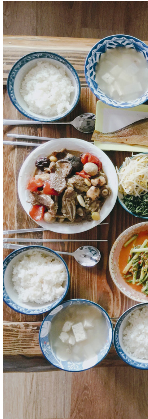
RECHTS: een tafel vol met Koreaanse gerechten.

Met dat in gedachten hoop ik dat deze reis door een van de fascinerendste en meest ontwikkelde Aziatische landen je, op zijn minst, tot eenzelfde soort passie inspireert en je ook nog het een en ander leert over het Koreaanse leven.