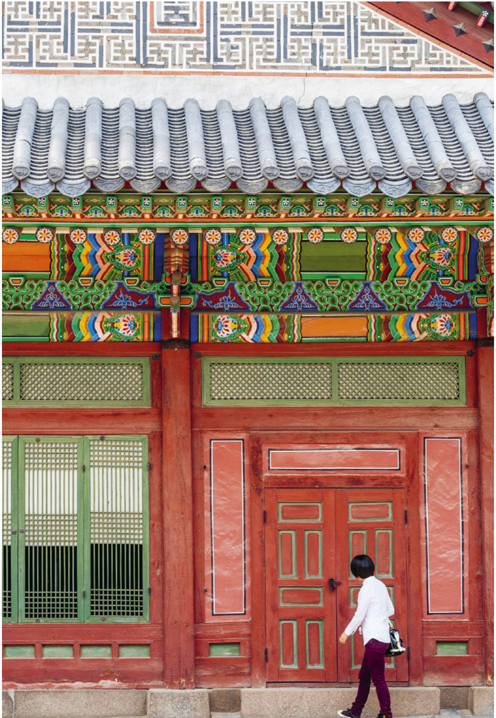
BOVEN: Deoksugung, het koninklijke paleis van de Joseon-dynastie, in Seoel.