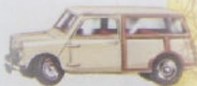
197 Morris Mini-Traveller 2½" — 73 mm

Het straatbeeld verandert eind jaren vijftig niet alleen in de grote steden. Ook in de smalle straatjes van kleine dorpen kun je veel toeristen met hun auto's vinden.