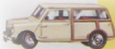
197 Morris Mini-Traveller 2½" — 73 mm.