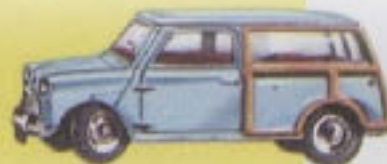
199 Austin 7 Countryman 2½" — 73 mm.