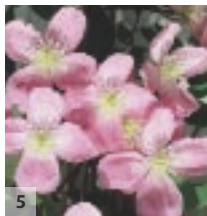
5 ↑ 5m ↔ 2-3m

1 Clematis 'Frances Rivis' ♀ 2 C. 'Markham's Pink' ♀ 3 C. montana var. grandiflora ♀ 4 C. montana var. rubens 5 C. montana var. rubens 'Tetrase' ♀