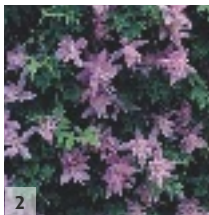
2 ↑ 2-3m ↔ 1.5m