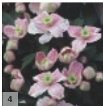
4 ↑ 10m ↔ 2-3m

'Freckles' Roomwitte bloemen met rozig bruine spikkels