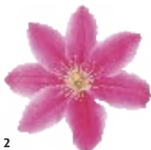
2 ↓ 2.5m ↔ 1m