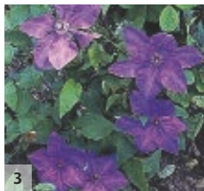
3 ↓ 2-3m ↔ 1m

1 Clematis 'Bees' Jubilee' 2 C. 'Doctor Ruppel' 3 C. 'Elsa Späth'