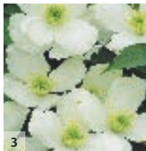
3 ↑ 10m ↔ 4m