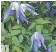
1 h2-3m ↔ 1.5m